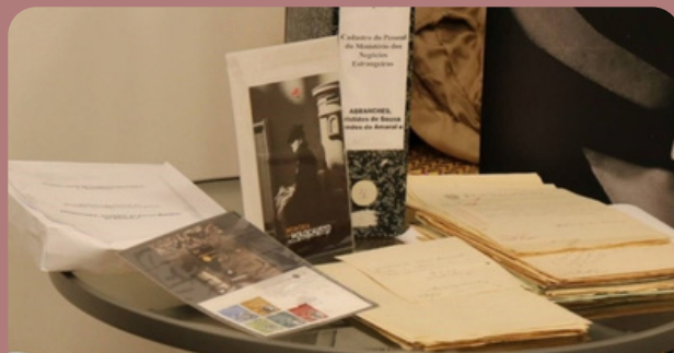
Documentos do processo contra Aristides de Sousa Mendes.