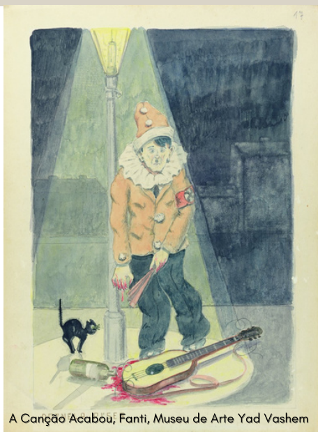
A Canção Acabou; Fanti, Museu de Arte Yad Vashem

Para além de repositório da milenar memória histórica da presença judaica na cidade e no país, professores e alunos irão dispor de um recurso fundamental para alargar o âmbito das suas aulas e conhecimentos .